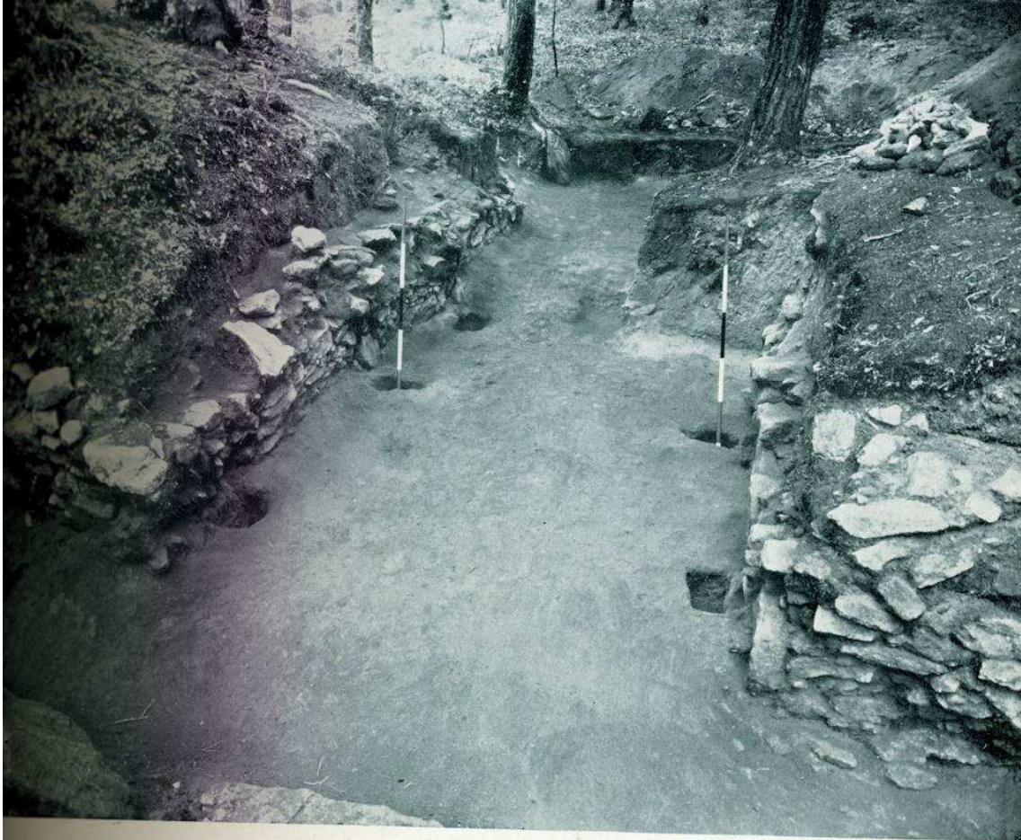
A. Le Camp d'Artus: SE. entrance from the outside